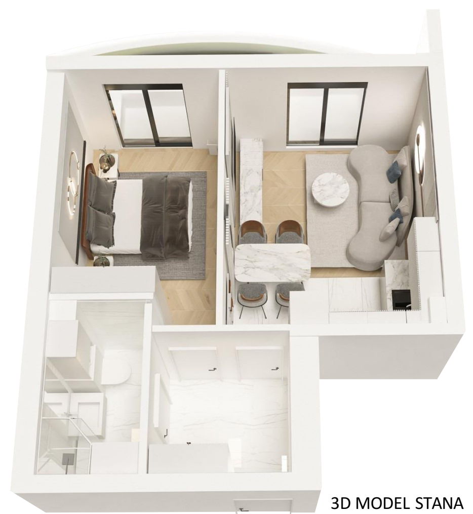
3D MODEL STANA